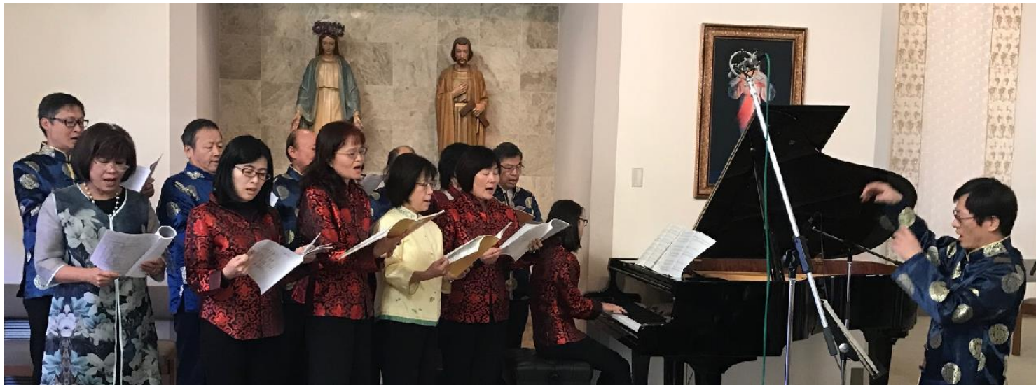
本會代表參與 St. Justin Martyr 感恩節彌撒慶典，於眾領聖體時，合唱感恩歌。