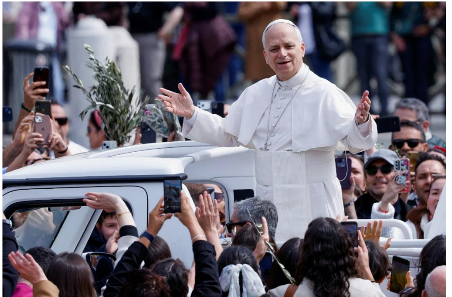
教宗良十四世 2026 年 3 月 29 日在梵蒂岡會見信眾

教宗為當今世界人類大家庭所承受的眾多創傷而痛惜，“所有遭受暴力壓迫及飽受戰爭之苦的人們發出痛苦的呻吟”。教宗說：“基督，和平的君王，再次從祂的十字架上呼喊：天主是愛！你們要有憐憫心！放下你們的武器！要記住你們都是弟兄姊妹！”